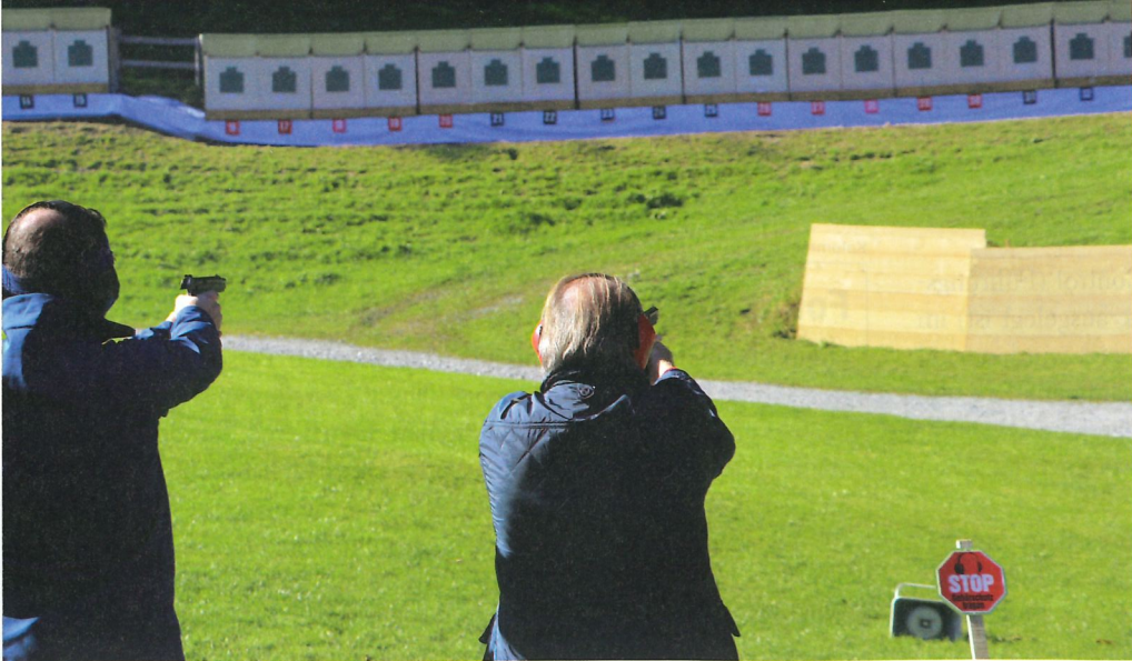
Schützen aus der ganzen Schweiz haben das Schiessprogramm auf 50 Meter absolviert.