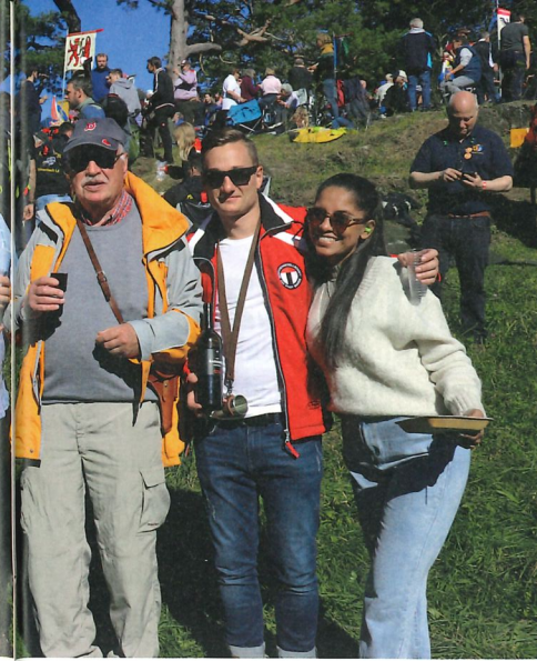
die Pflege der Freundschaft nicht zu kurz.