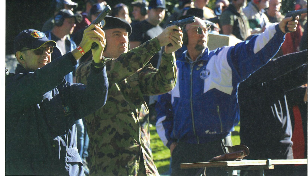
Auch der Chef der Armee nahm mit einer SIG P210 am Wettkampf teil.