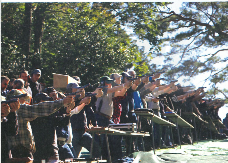
Das Historische Pistolen-Rütli-schiessen ist einer von zwei Schiessanlässen auf dem Rütli.