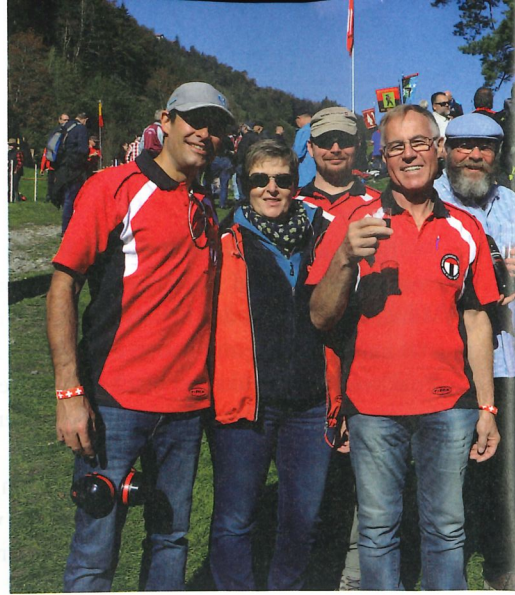
Neben dem Schiessbetrieb kam natürlich auch