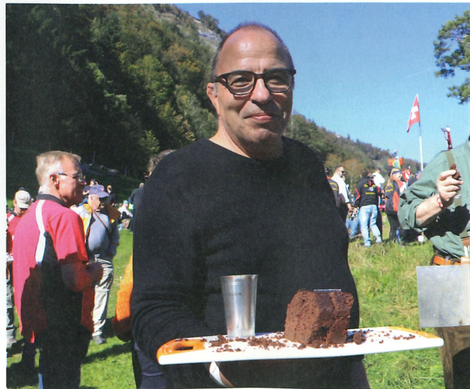
Gastfreundschaft wird bei den Schützen grossgeschrieben.